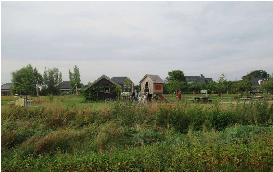
Bewoners Initiatief en Actief!