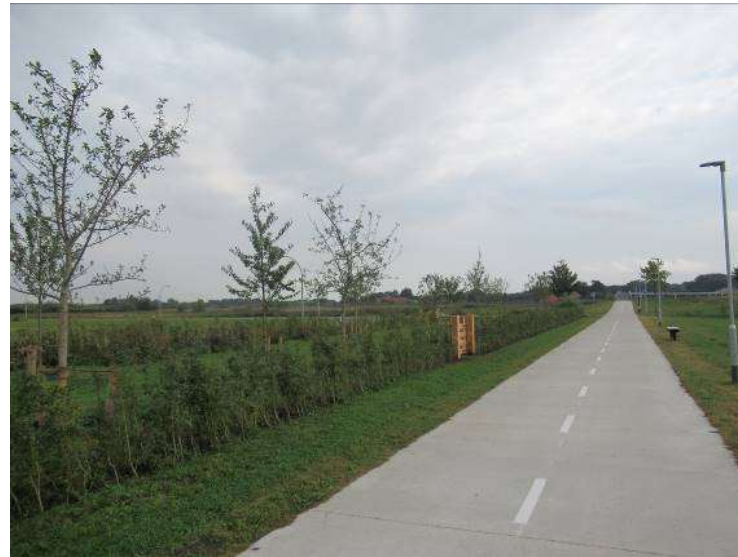
DE VERBINDING DE PIETER SMIT BRUG.

Vorrangsbord ontbreekt op de paal. Opmerkelijk dat er veel verkeersborden en naamborden worden gestolen in de gemeente Oldambt. Enorme kosten. Voorstel: pictogrammen op de weg aanbrengen en/of minder willen regelen. Alle verkeersborden en palen op dit plaatje kunnen weg.