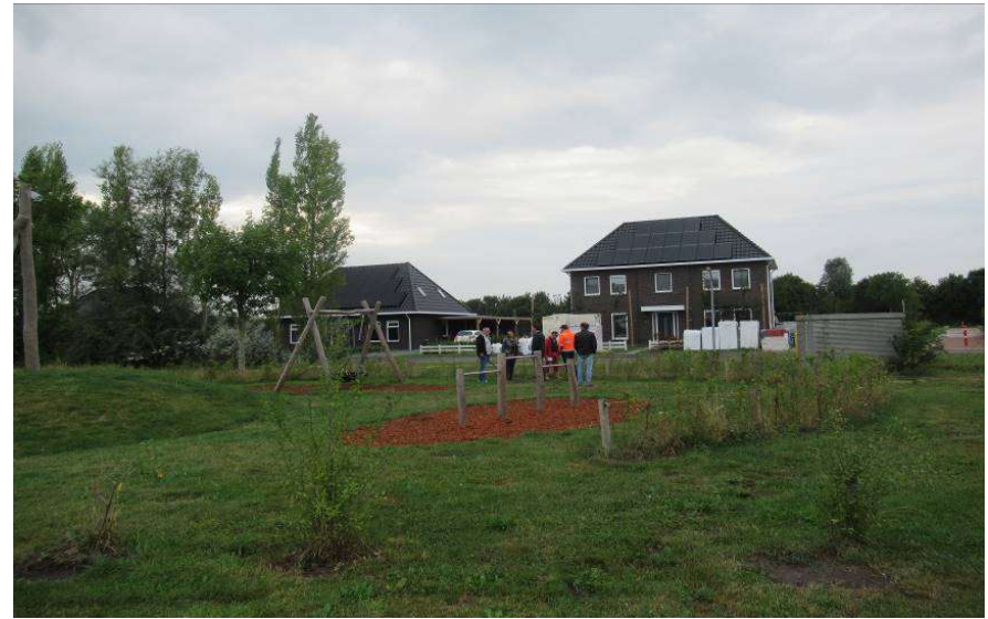
Haagje laten groeien een paar paaltjes extra en draadje.